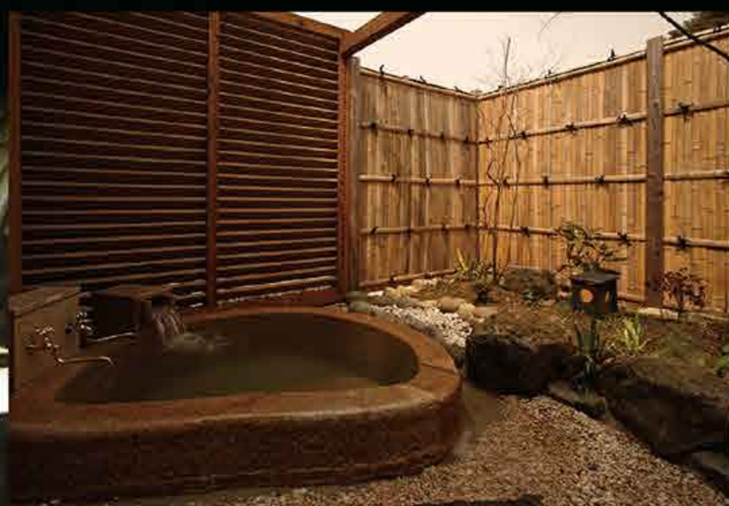
源泉掛け流し100%の良質天然いで湯