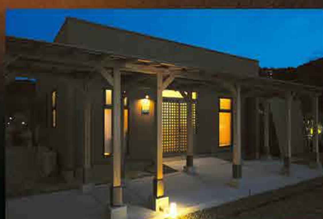
深く深く呼吸をすることが 楽しくなる空間