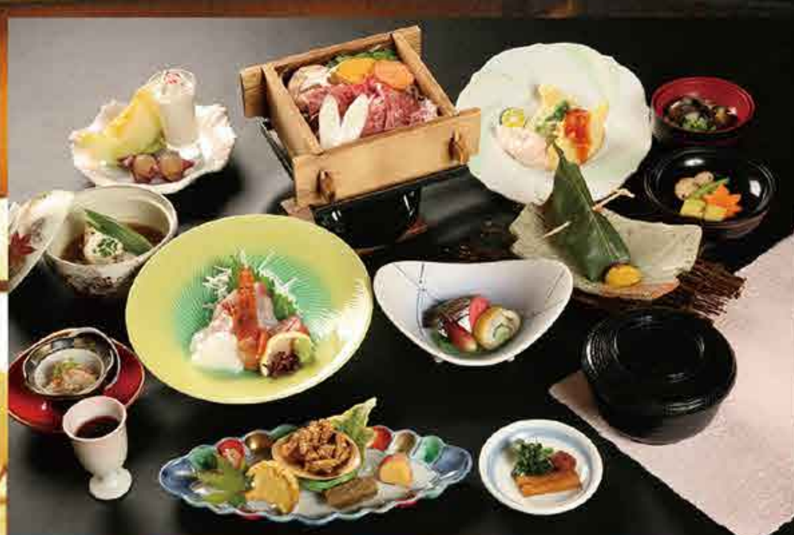
季節の料理の数々で「心をこめて」おもてなし